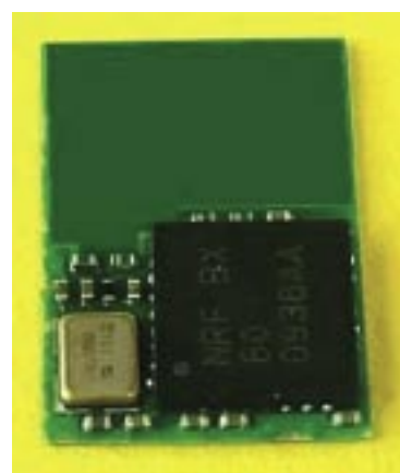
Le premier module Bluetooth Low Energy du marché est l'œuvre de la société française Insight SiP. Boîtier ouvert, on distingue le transceiver de Nordic Semiconductor entouré d'un oscillateur à quartz et d'une poignée de composants passifs. La partie supérieure est occupée par l'antenne imprimée.

Adoptée par le SIG en avril 2009, la version 3.0 HS promet des débits de 24 Mbits/s, soit bien au-delà des 1 à 3 Mbits/s alloués par les versions classiques ou EDR (Enhanced Data Rate) de Bluetooth. Un tel résultat est obtenu grâce à l'exploitation d'un lien radio 802.11. Les phases de négociation et d'établissement de la liaison sont ici